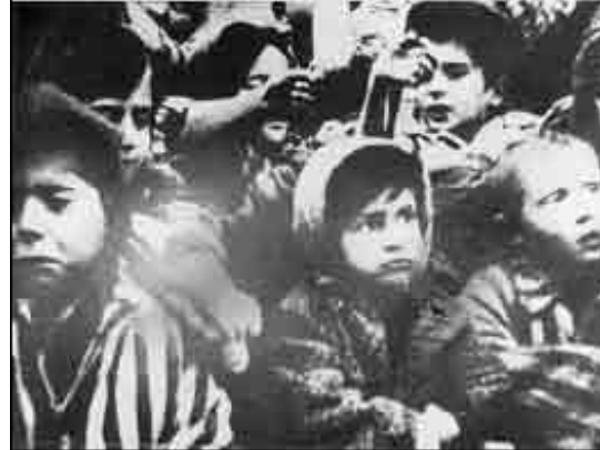
Un ex interno cerca de las barracas del campo. Niños en el campo, alzando sus manos a la vez en Bergen – Belsen, Alemania (Yad Vashem) Liberación, Auschwitz, Polonia (Yad Vashem)