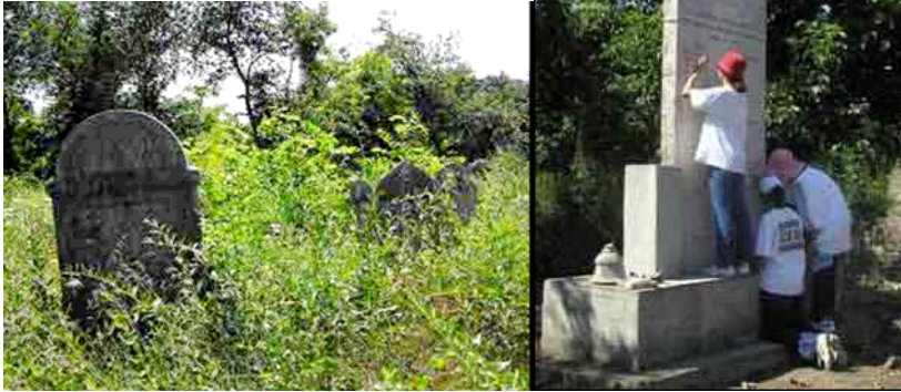
Estudiantes limpiando un cementerio judío abandonado en Szob, Hungría, 2002 (Escuela de la Comunidad Judía Lauder Javne, Budapest)