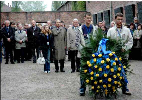
Depositando una ofrenda floral en el Valle de la Muerte en el patio del Bloque 11 en el 1-Stammlager de Auschwitz. Delegaciones de jóvenes y los Ministros de Educación de los 48 Estados Socios de la Convención Cultural Europea, participantes del seminario internacional “Enseñando a recordar a través de la herencia Cultural”, Cracovia y Auschwitz- Birkenau, Polonia, 4-6 de mayo de 2005.

En octubre del año 2002, los Ministros de Educación de los estados miembros del Consejo de Europa dieron curso a la resolución de que se instituyera un “Día de Recordación” en todas las escuelas de sus respectivos países para conmemorar el Holocausto. 1 Además, durante la reunión del plenario de su sexta asamblea general en noviembre de 2005, las Naciones Unidas decidieron hacer del 27 de Enero el día internacional de conmemoración para honrar a las víctimas del Holocausto, y urgieron a los estados miembros a desarrollar programas educativos para transmitir la memoria de esta tragedia a las futuras generaciones. 2