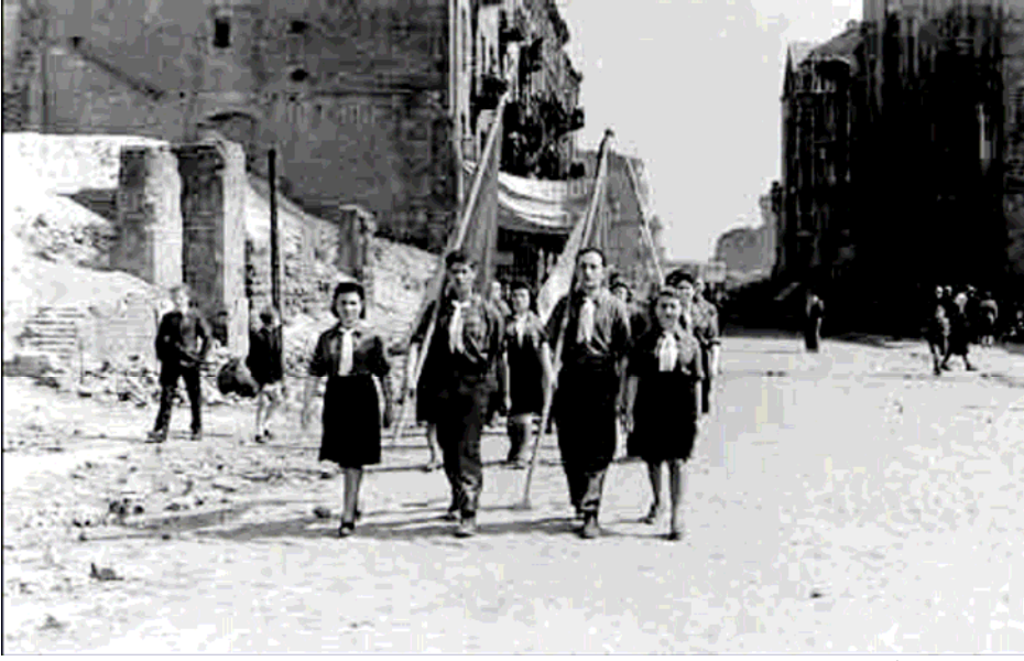
Varsovia, Polonia, posguerra, Marcha de Recordación de las víctimas del Holocausto.

En octubre del año 2002, los Ministros de Educación de los estados miembros del Consejo de Europa dieron curso a la resolución de que se instituyera un “Día de Recordación” en todas las escuelas de sus respectivos países para conmemorar el Holocausto. 1 Además, durante la reunión del plenario de su sexta asamblea general en noviembre de 2005, las Naciones Unidas decidieron hacer del 27 de Enero el día internacional de conmemoración para honrar a las víctimas del Holocausto, y urgieron a los estados miembros a desarrollar programas educativos para transmitir la memoria de esta tragedia a las futuras generaciones. 2