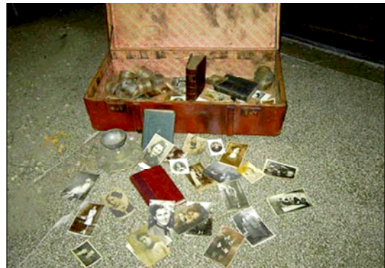
Auschwitz, Polonia, posguerra. Maletas en el Museo. Esta maleta, parte del proyecto del Día de Recordación del Holocausto de Yad Vashem, fue creada por estudiantes del Club del Recuerdo, Colegio Nacional Vlaicu Voda, Rumania, octubre de 2004.